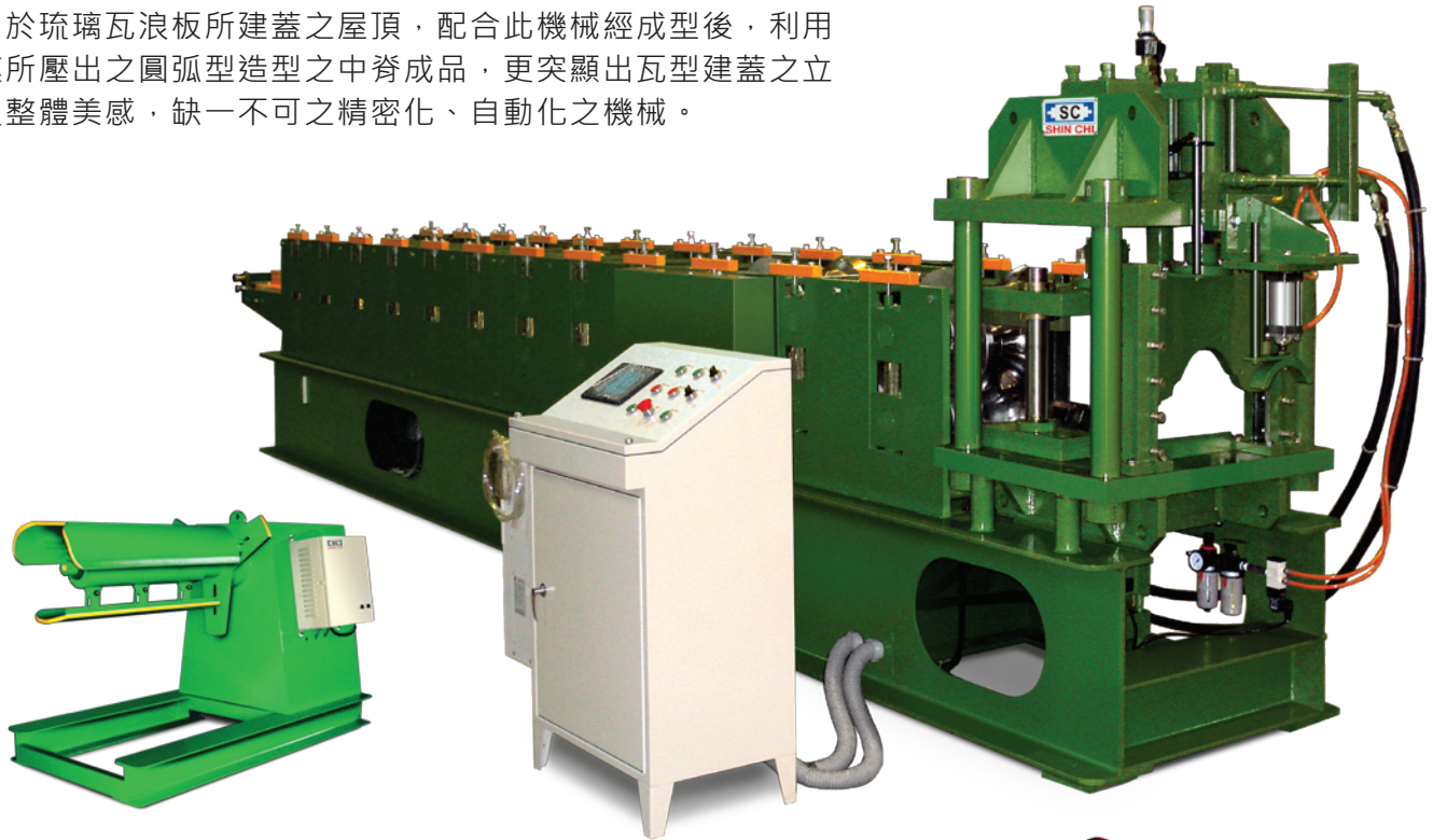
單頭放料架 Single Head Hydraulic Uncoiler

多用於琉璃瓦浪板所建蓋之屋頂，配合此機械經成型後，利用壓模所壓出之圓弧型造型之中脊成品，更突顯出瓦型建蓋之立體及整體美感，缺一不可之精密化、自動化之機械。